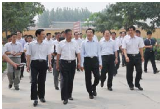
2010年8月31日，河北省委书记张庆黎（右三） 视察黄儿营西村