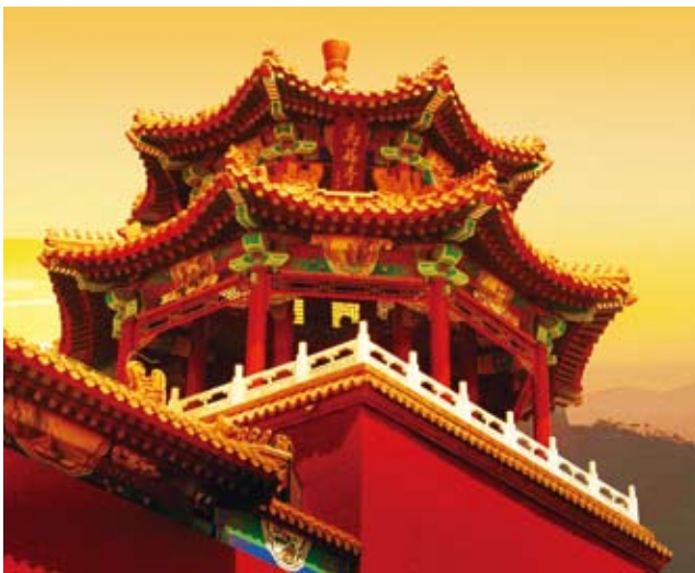
温都水城国际酒店——万福亭

1996年北京宏福集团成立时，随即创立了“村企合一”的发展机制。1999年宏福集团进行产权制度改革，确定了公司法人、村委会和村民的股份关系，特别是创业者们放弃了政策允许为有突出贡献者配置干股的优厚待遇，同大家一样用现金入股。由此认定了宏福集团即不是私有制，又不是绝对的集体所有制，而是以农民为投资主体、发展成果共享的新型集体经济模式。为了帮助村民理财，集团承诺每年的股份分