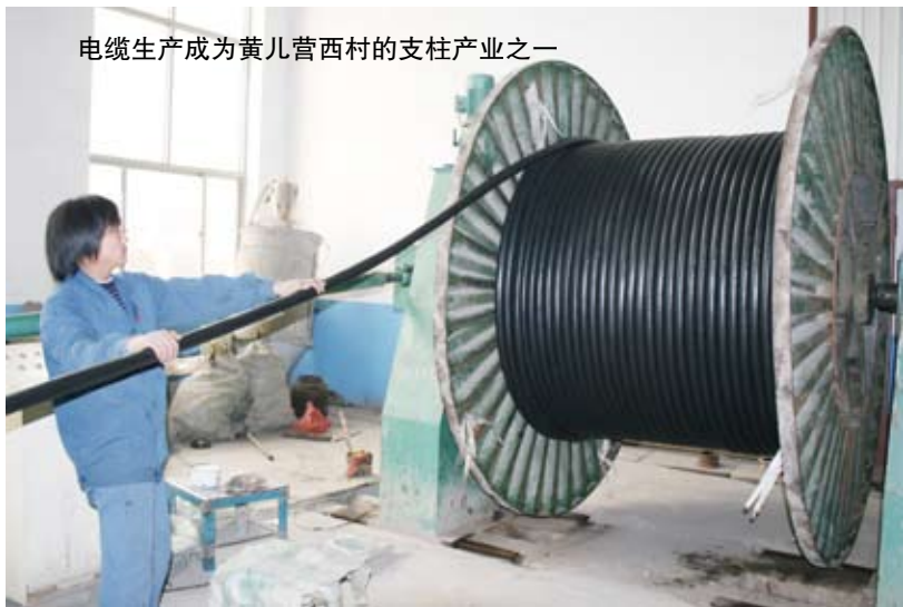
电缆生产成为黄儿营西村的支柱产业之一