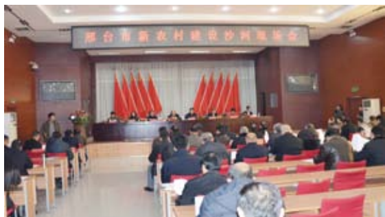
新农村建设现场会