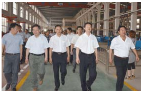
市委书记王爱民（右二）、市长刘大群（左二） 考察黄儿营西村