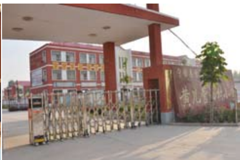
黄儿营西村寄宿制小学