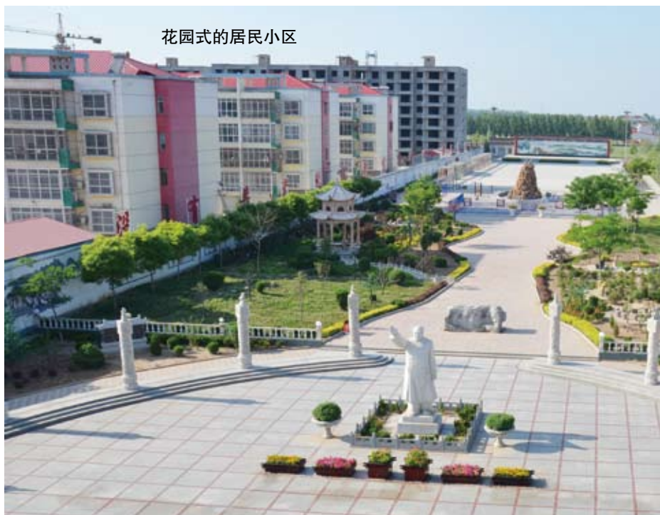
花园式的居民小区

第二项工作：“还生态池塘，解决全村排水之忧”。俗话说：“喊破嗓子，不如做出样子”，为了调动广大村民的积极性，宁书记脏活重活冲到最前面，村里全体党员齐上阵，在炎炎的烈日下，他们挥汗如雨，整整干了30天，动用人力1500余次，推土机8辆，千方百计筹措资金50余万元。待到工程结束时，宁书记简直就像变了一个人，脸庞黝黑黝黑，满手都是血泡，回到家里孩子们看到父亲这般模样，心痛得直落泪。爱人心疼地责备