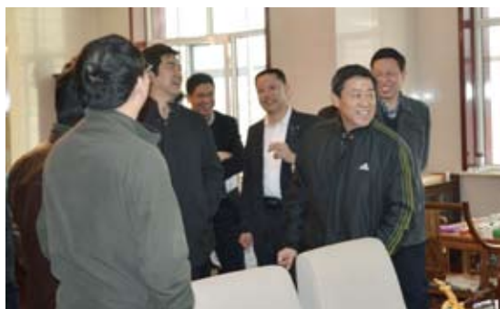
宁晋县委书记孔祥友（右一） 在黄儿营西村调研