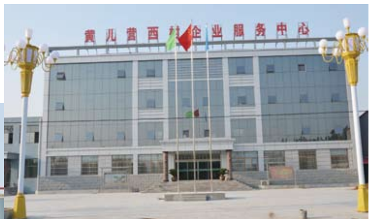
黄儿营西村企业服务中心

摆在眼前的客观现实是：一方面村庄境况混乱；另一方面，宁小五时任宁联电缆集团有限公司董事长，他的公司年产值超亿元，自己的事业如日中天，红红火火，他完全有成为亿万富翁的可能。而就在此