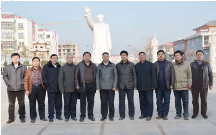
团结奋进的村党总支

“河北省新民居建设样板村”，村“两委”坚持以城市化的理念建设新农村，聘请河北安远规划设计院编制了村庄规划。经过近几年的建设，该村总体上形成了棋盘式格局，纵横有序，方正整齐。进村道路和主干街道平整开阔，并在两侧进行了高标准铺装衬砌和绿化，安装了造型新颖的路灯。其他小街小巷也按照统一标准进行了硬化、美化。在村庄西北处投资2800万元建成了可容纳162户的住宅小区，小区内设施完备、功能配套，村民的居住条件和居住环境得到了明显改善。投资350万元，在小区东侧新建的民乐广场占地20亩，各类健身设施齐全、景观造型异常优美，成为村民们休闲、娱乐的好去处。黄儿营西村新民居建设的成果得到了各级领导和媒体的关注。2011年8月31日，河北省委书记张庆黎在上任第三个工作日就来到该村视察新农村建设情况；原省长陈全国对村里的新民居建设给予了高度评价和充分肯定；省群工办副主任王和平，邢台市委书记王爱民、市长刘大群，县委书记孔祥友、县长张栋华等领导先后来这里视察指导工作。黄儿营西村新民居建设作为河北省新民居建设的典型代表，走进中央电视台《新闻直播间》。布局合理、村容整洁、环境优美的黄儿营西村吸引着省内外参观者惊羡的目光。